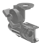
M-500 Suporte Calha Zamak