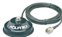
M-700K Suporte Magnético 4,0 m Cabo